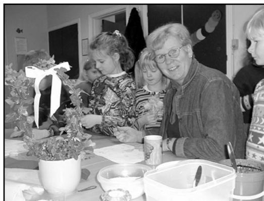
Sfo, Anni, ser på fotografen.