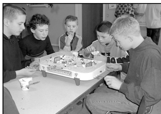
Nye spil på skolen, fodboldspil.