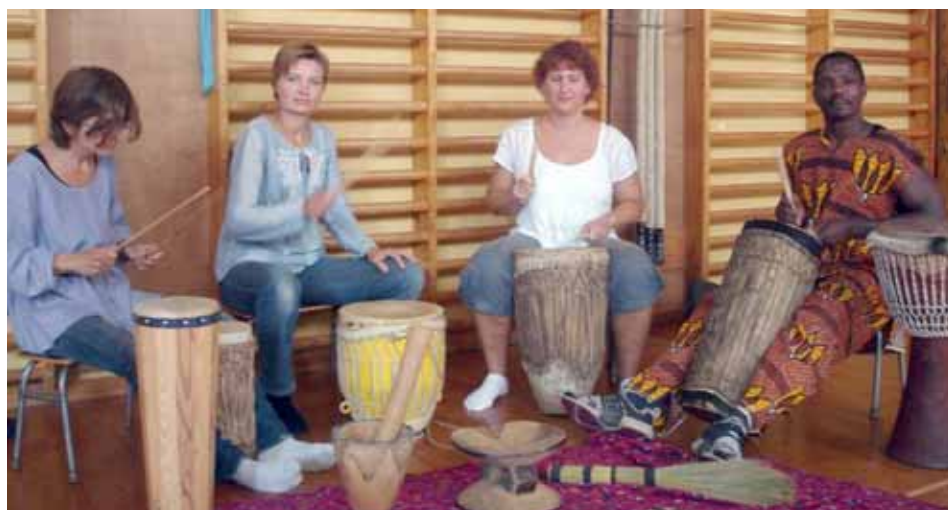
Personale øver trommerytmer