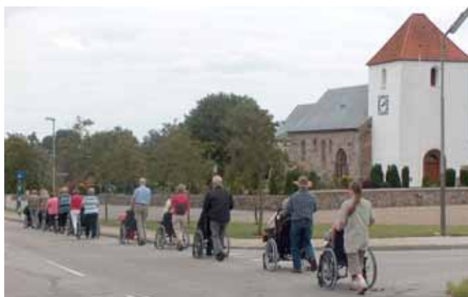
Karavanen af kørestole på vej