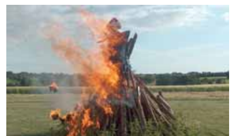
Bålet brænder godt