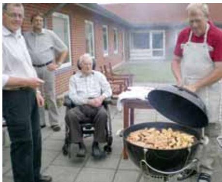
Grillaften med pårørende og personale