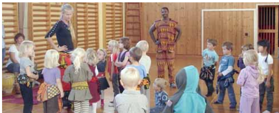
Forberedelse til dans