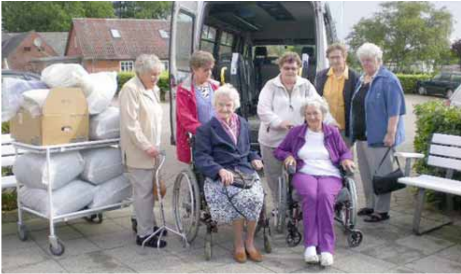
Vi er på vej til Støvring med 29 tæpper m.m. til Mother Theresas arbejde