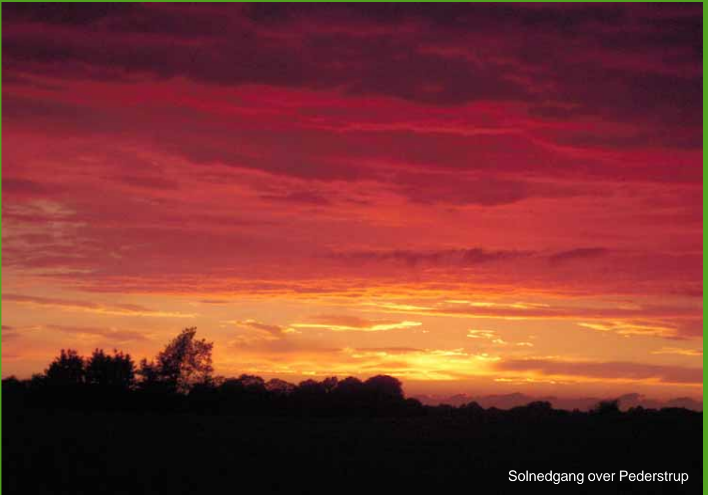
Solnedgang over Pederstrup