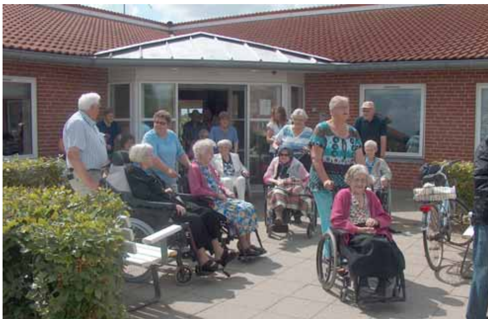
Klar til afgang