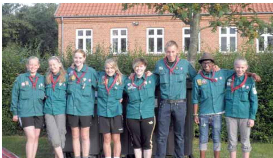
Den friske trop er klar til afgang!

Torsdag formiddag skulle vi på en MEGA-aktivitet mere, som var „Vild med ild“, men det var overhovedet ikke sjovt, fordi vejret var mega dårligt og vådt. Men vi prøvede! Om eftermiddagen, da vi kom hjem fra MEGA-aktiviteten, sagde vores