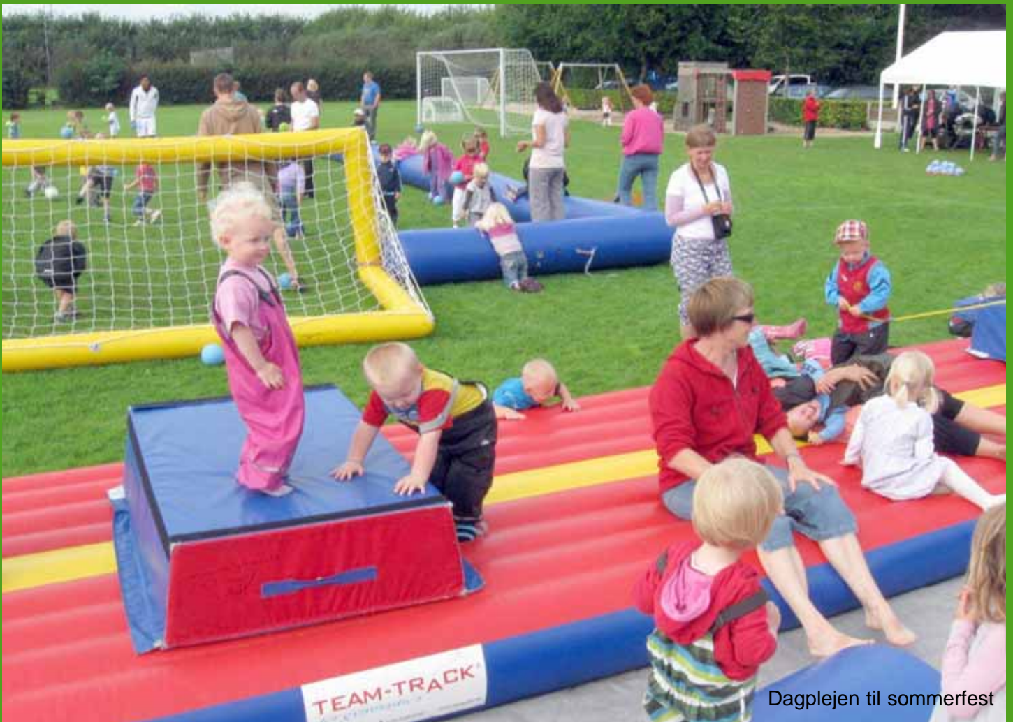
Daglejen til sommerfest