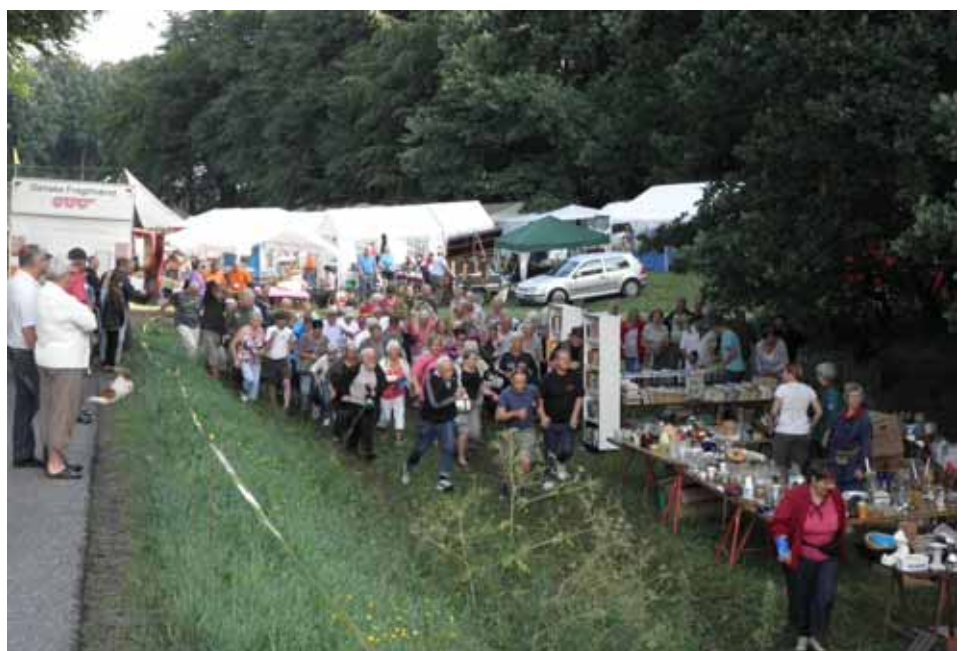
Kunderne myldrer frem