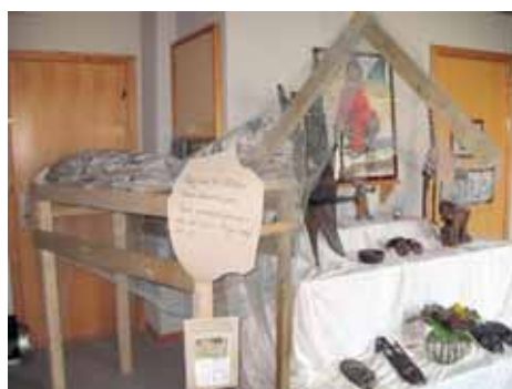
Afrikaudstilling med zebra

Vi var rigtig heldige, at det var fint vejr ved vores deltagelse i byfesten. Det var skønt at blive inviteret til et flot arrangement, og som personale var det selvfølgelig dejligt at overgive sig