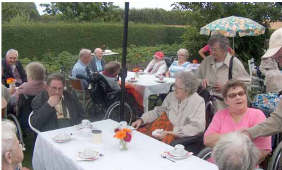
Fra Guldborgs have