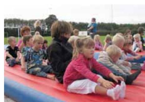
Vi ror i piratskibet