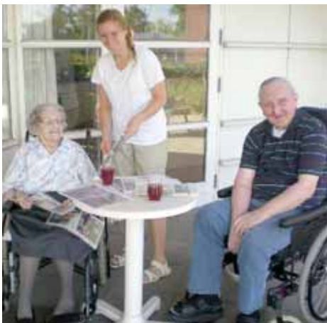
Hygge på terrassen