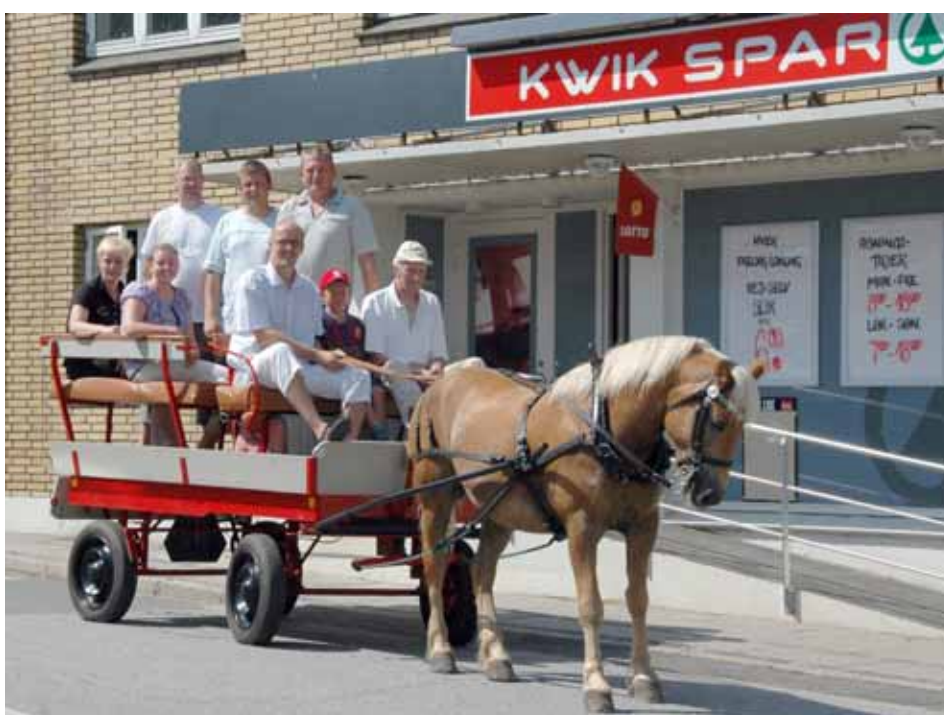
Den nye købmand ses her med den nye bestyrelse på rundtur i hestevogn