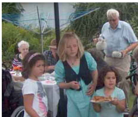
Guldborgs havde nogle søde og dygtige serveringspiger til at hjælpe